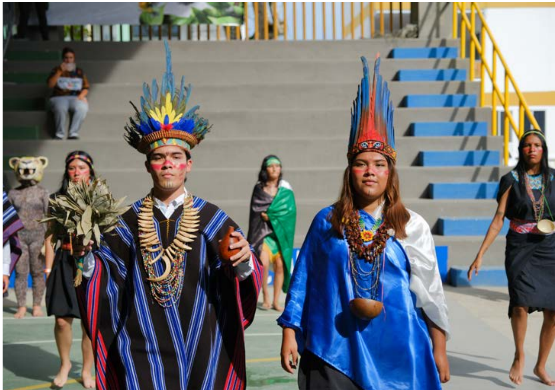
Indígenas del Putumayo dieron la bienvenida al presidente Petro en Puerto Asís