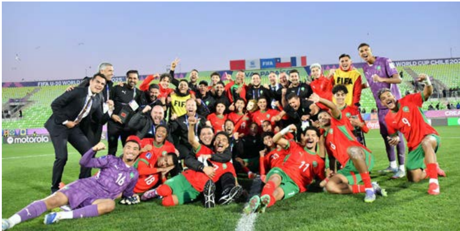
Celebración de Marruecos su clasificación a la final del mundial sub 20