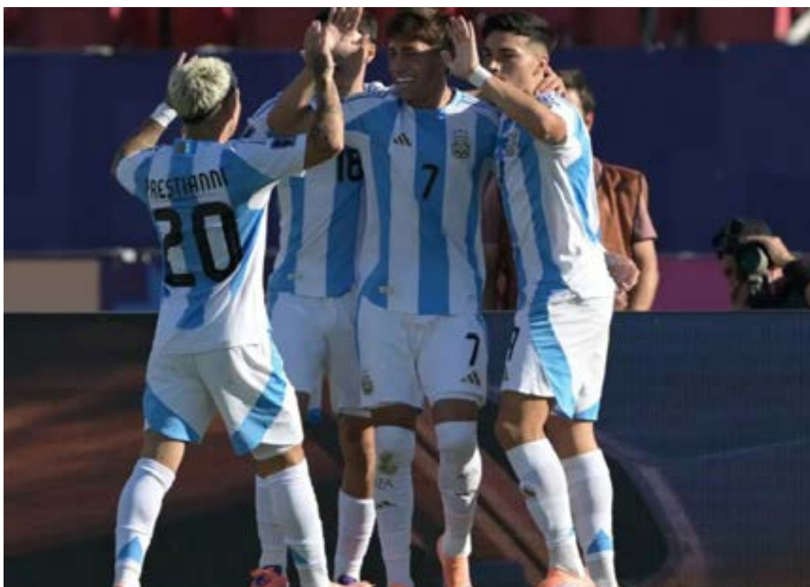
La Selección Argentina celebra su pase a la final del Mundial Sub-20, donde buscará la gloria ante la revelación del torneo, Marruecos.