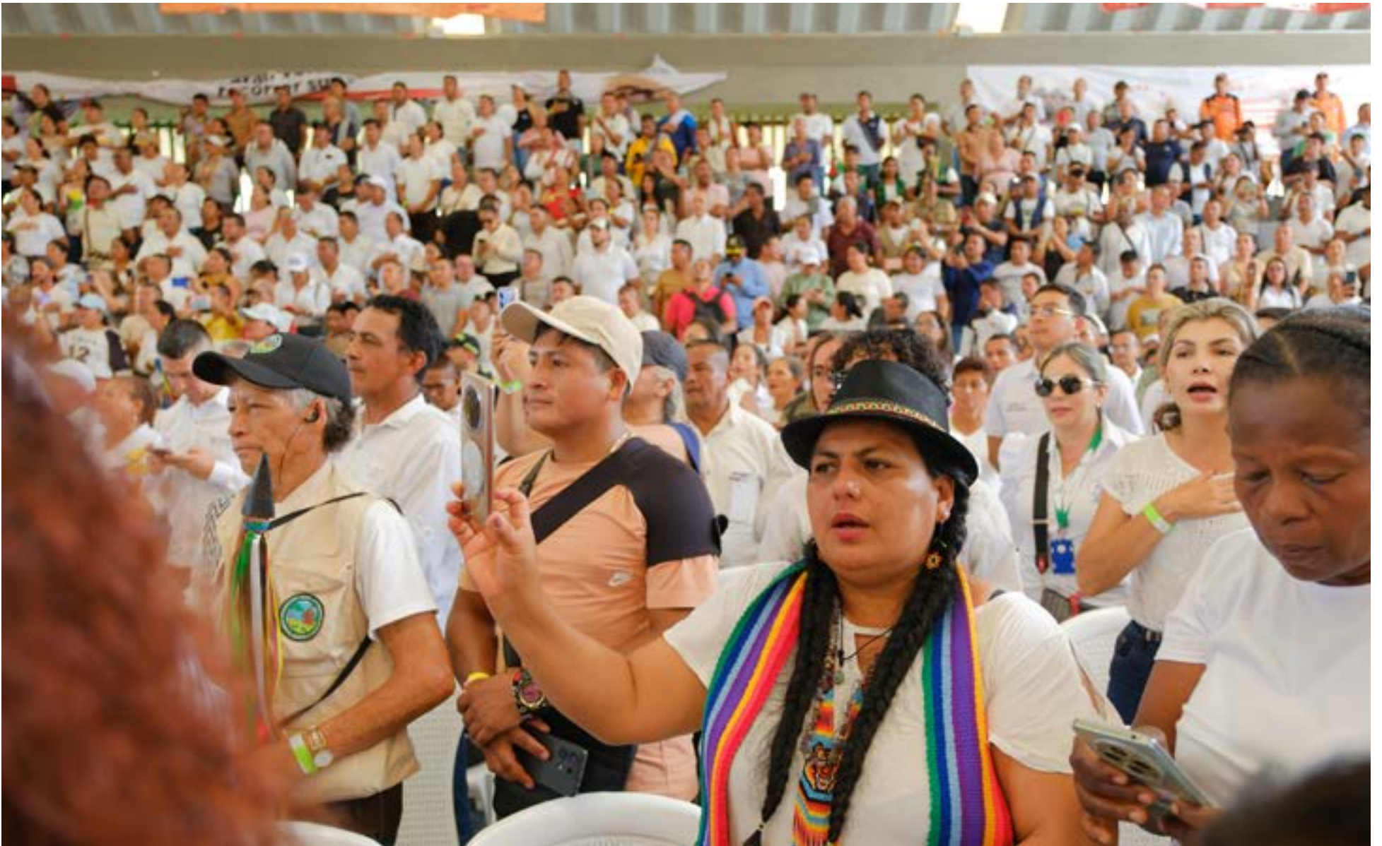
Las comunidades indígenas del Putumayo han mantenido diálogos constantes con el Gobierno para abordar problemas de seguridad, educación, salud, tierra y falta de inversión social, así como la contaminación petrolera en sus territorios.