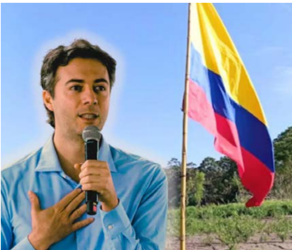
Daniel Quintero, renunció a la consulta del Pacto Histórico