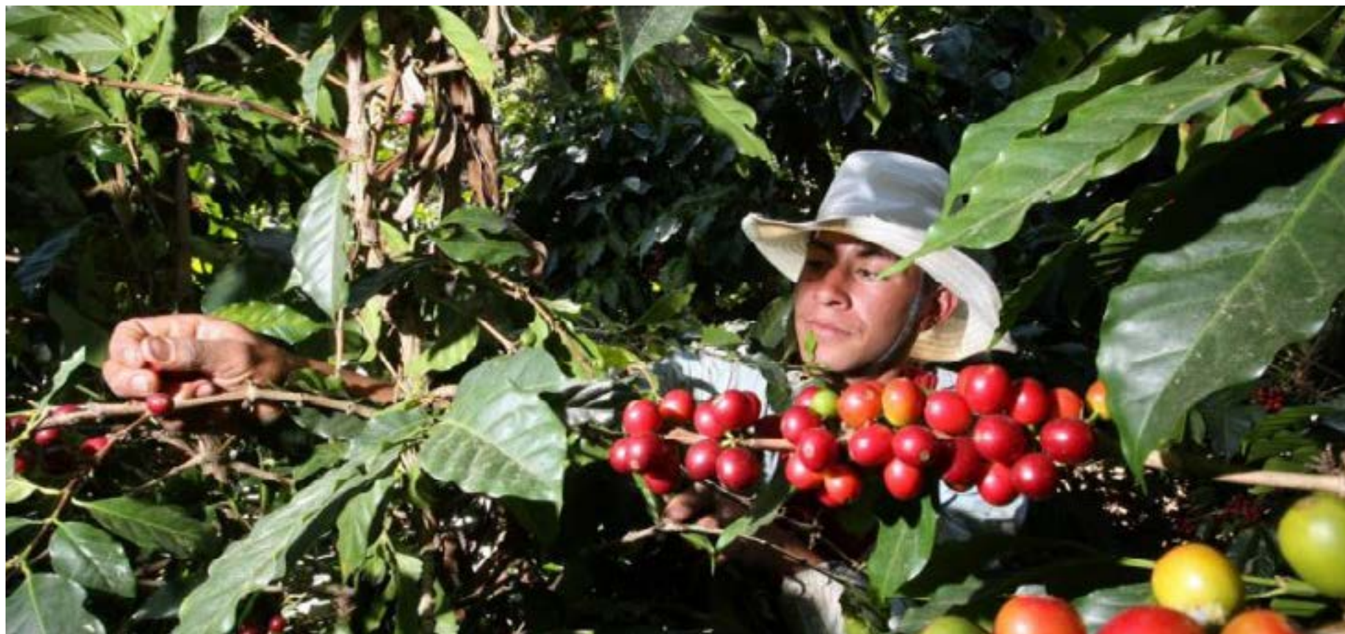
Calarcá es la puerta del café en Colombia