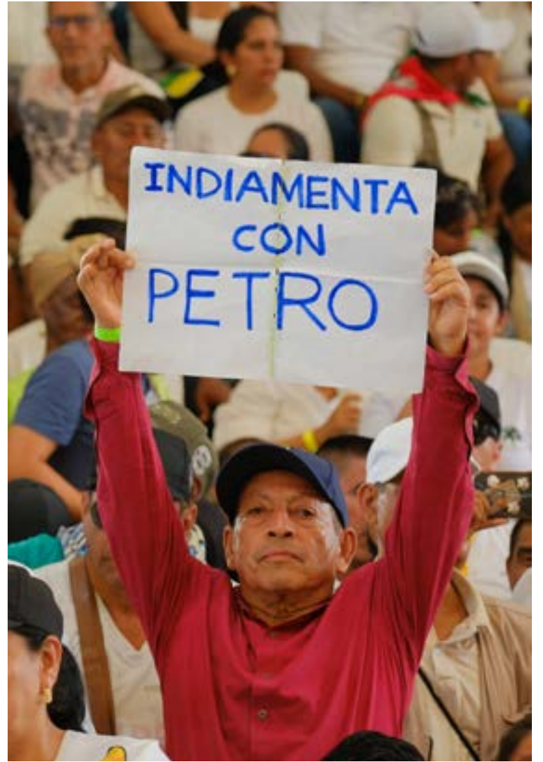
El cartel «Indiamenta» es una apropiación desafiante de un término peyorativo usado por las élites para discriminar a los pueblos indígenas, reivindicando así su identidad.