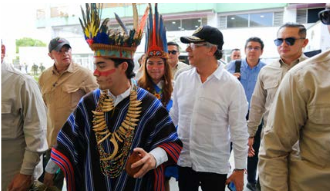
«Me siento como en casa», les dijo el presidente a los indígenas del Putumayo que lo recibieron.

El mandatario aprovechó el evento para enviar un