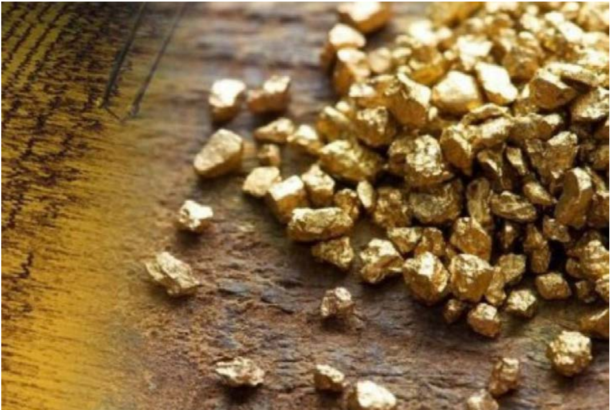
Los actuales precios del oro, sin duda, van a provocar que más gente se pase de la coca a la minería ilegal.

queños mineros formalizados. Grandes cantidades de oro ilícito son asignadas fraudulentamente a estos individuos para que figuren como producción legal.