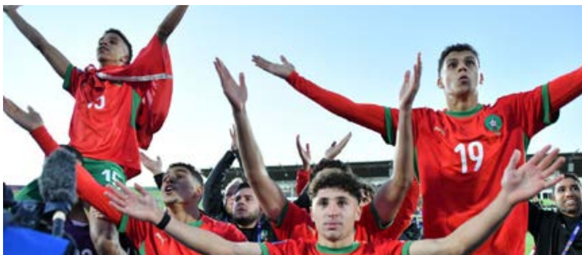
Marruecos celebra en semifinal del Mundial Sub-20