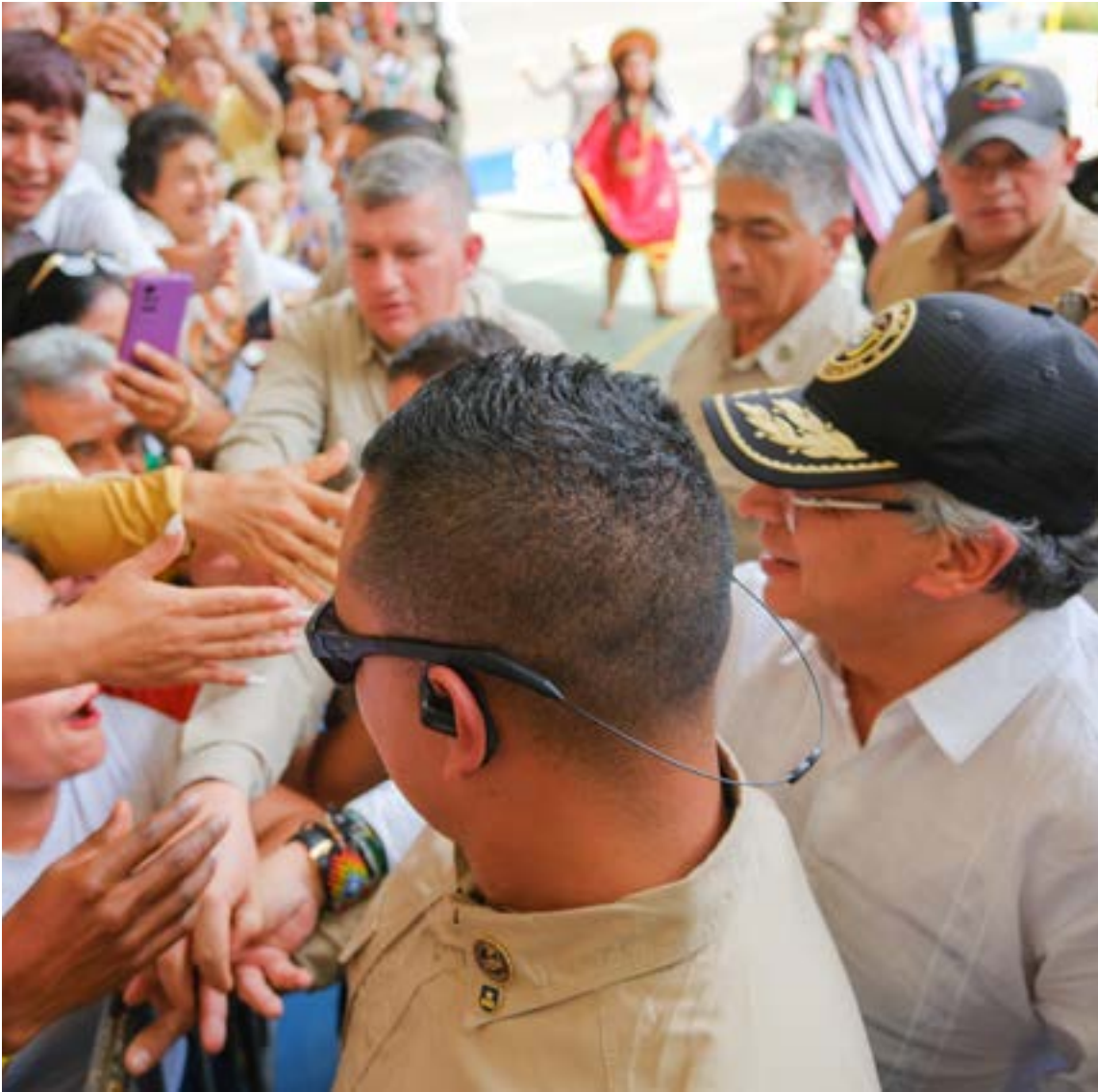
Los putumayenses saludan al presidente Petro.