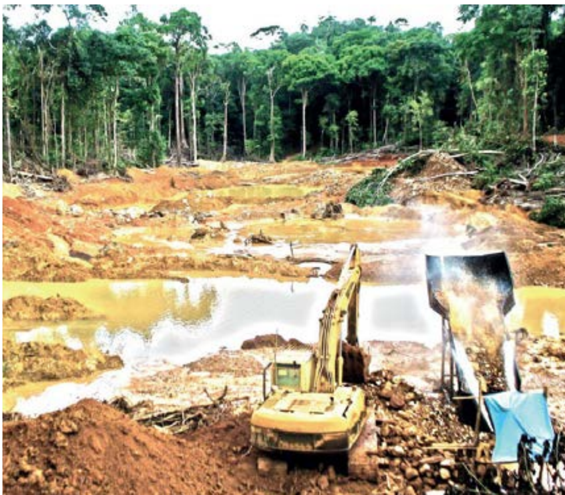
La minería ilegal de aluvión, que se concentra en los ríos Cauca y Nechí, es la principal fuente de destrucción ambiental, causando una grave contaminación por mercurio y cianuro.

El control territorial y los enfrentamientos han ge-