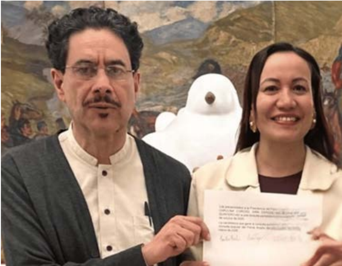
Cepeda y Corcho se disputan la candidatura del Pacto Histórico

Iván Cepeda: El senador, emblema de la izquierda militante, defiende la continuidad del proceso, en-