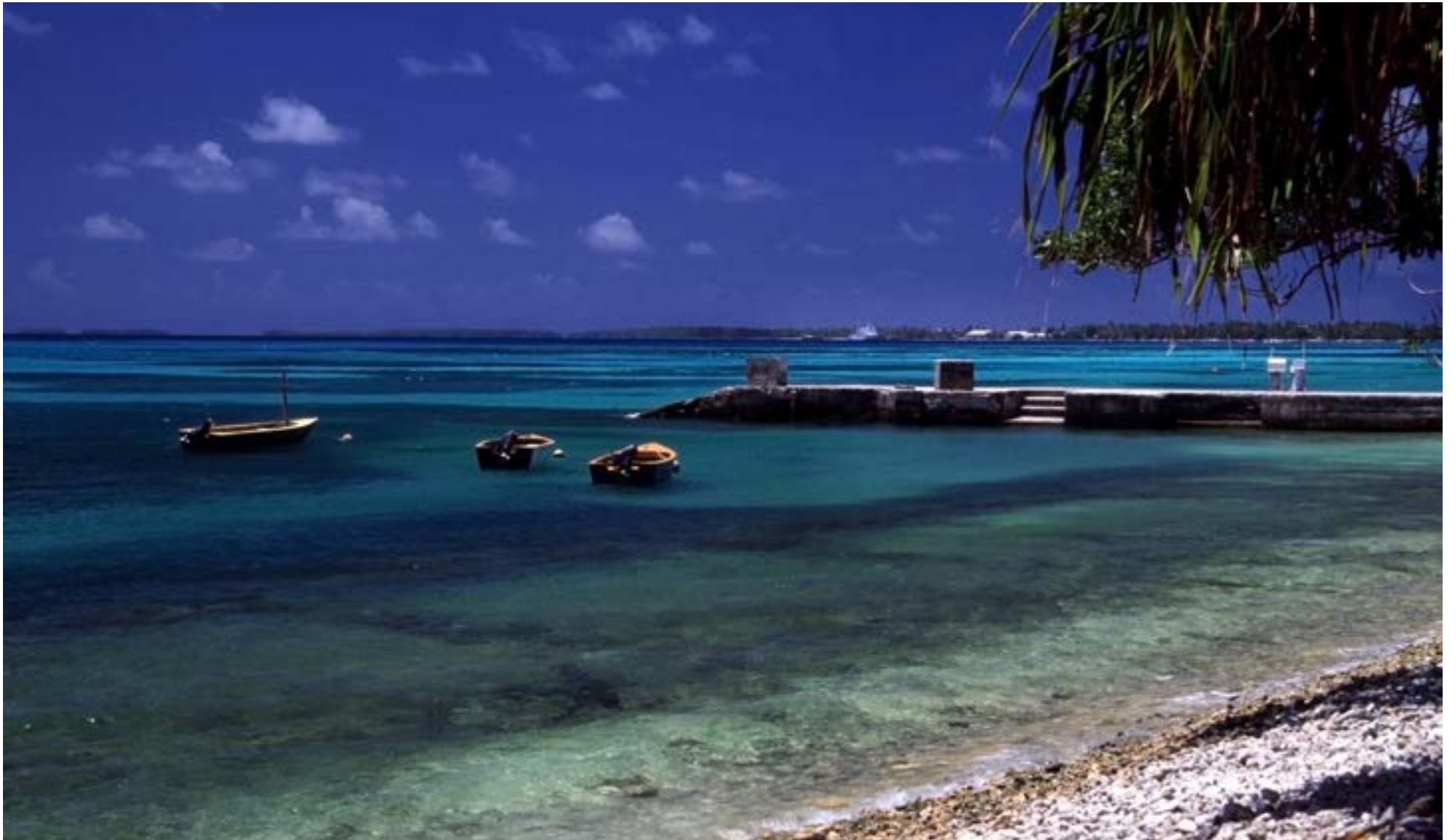
Muelle en una playa del atolón de Funafuti