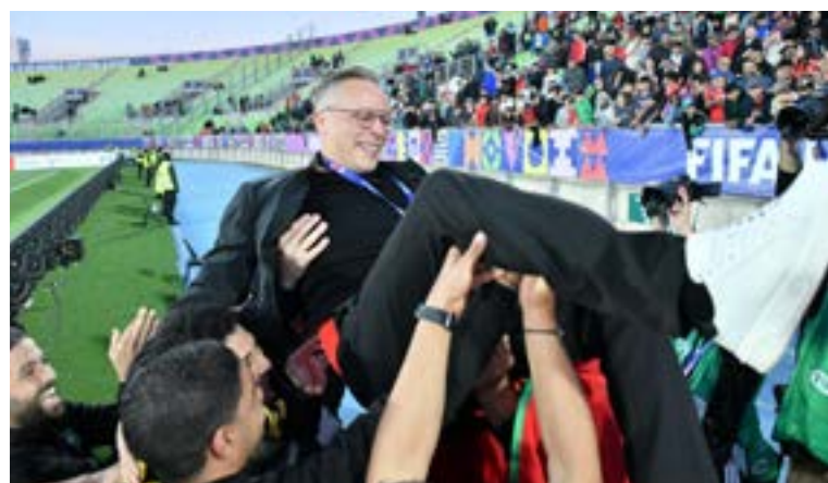
Tras la histórica clasificación, el técnico de Marruecos fue aclamado y alzado en hombros por sus jugadores en medio de la euforia por alcanzar la final.